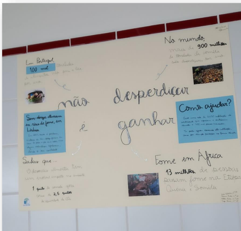
As imagens em anexo representam as várias formas de divulgação à comunidade educativa do quão grave é o desperdício alimentar e possíveis medidas para o combater, promovendo uma alimentação sustentável .