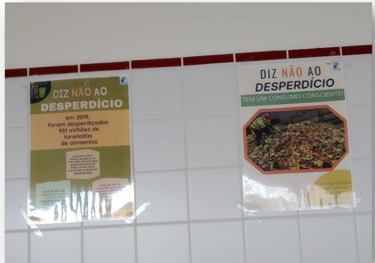
Fig. 2 – Cartazes realizados pelos alunos relativos ao tema