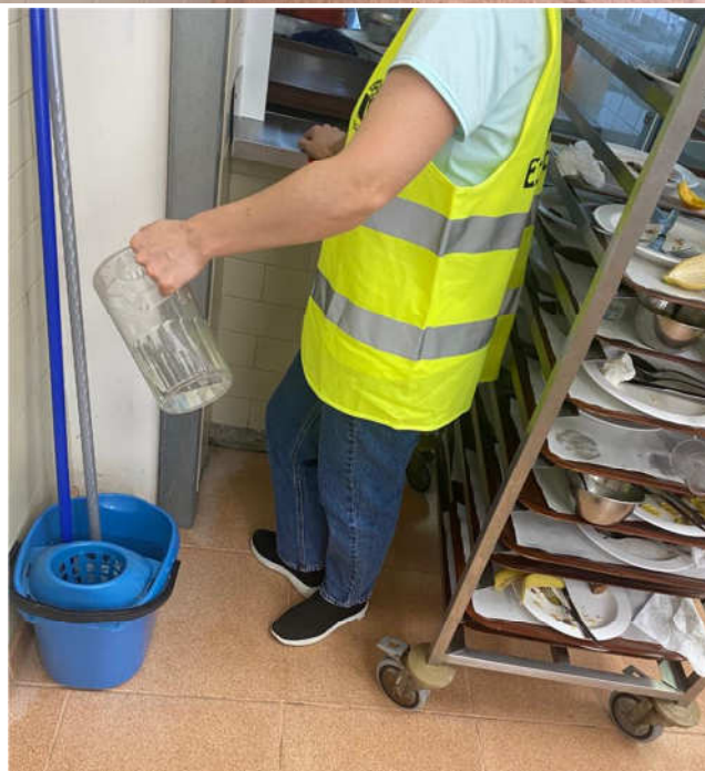
Alunos a recolherem o que restou da água dos copos e das canecas. A água é sempre recolhida no balde.