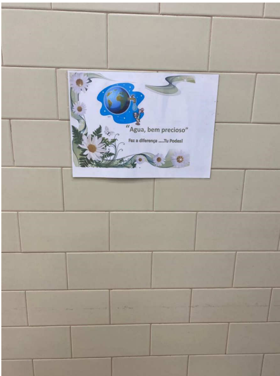
Cartaz da campanha de redução do desperdício de água