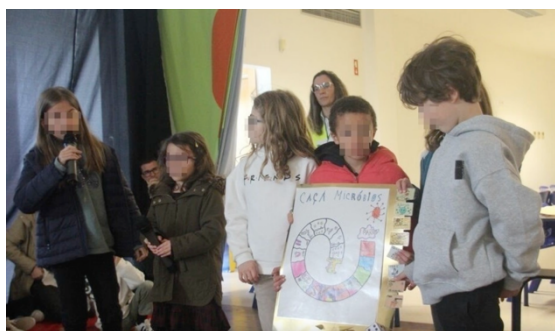
Figura 6 - Apresentação dos trabalhos em Assembleia de Escola (Higiene das Mãos)