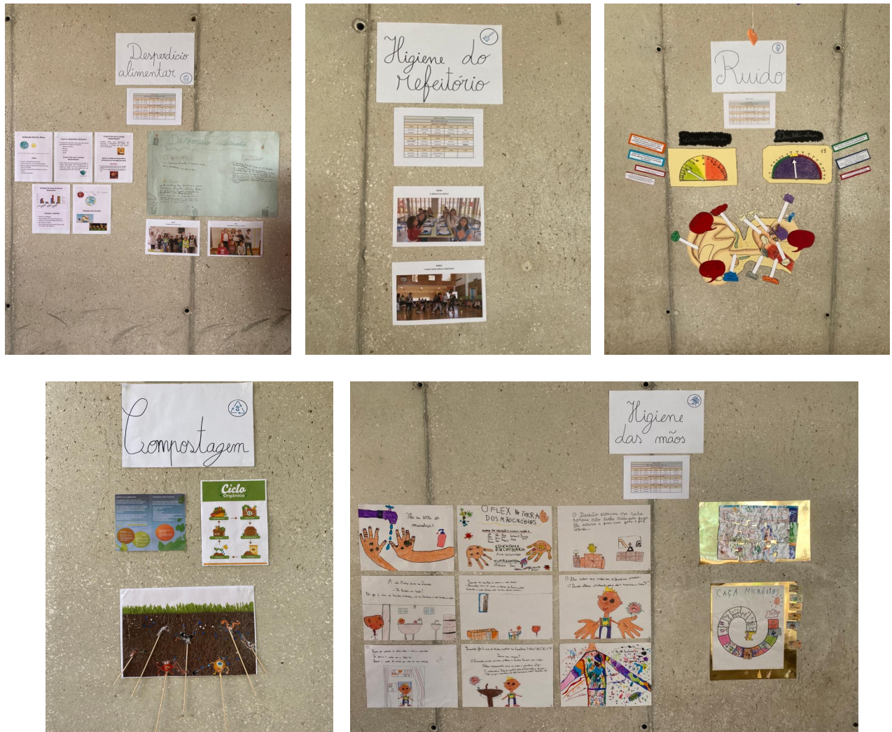
Figura 3 - Exposição do Projeto na entrada de escola