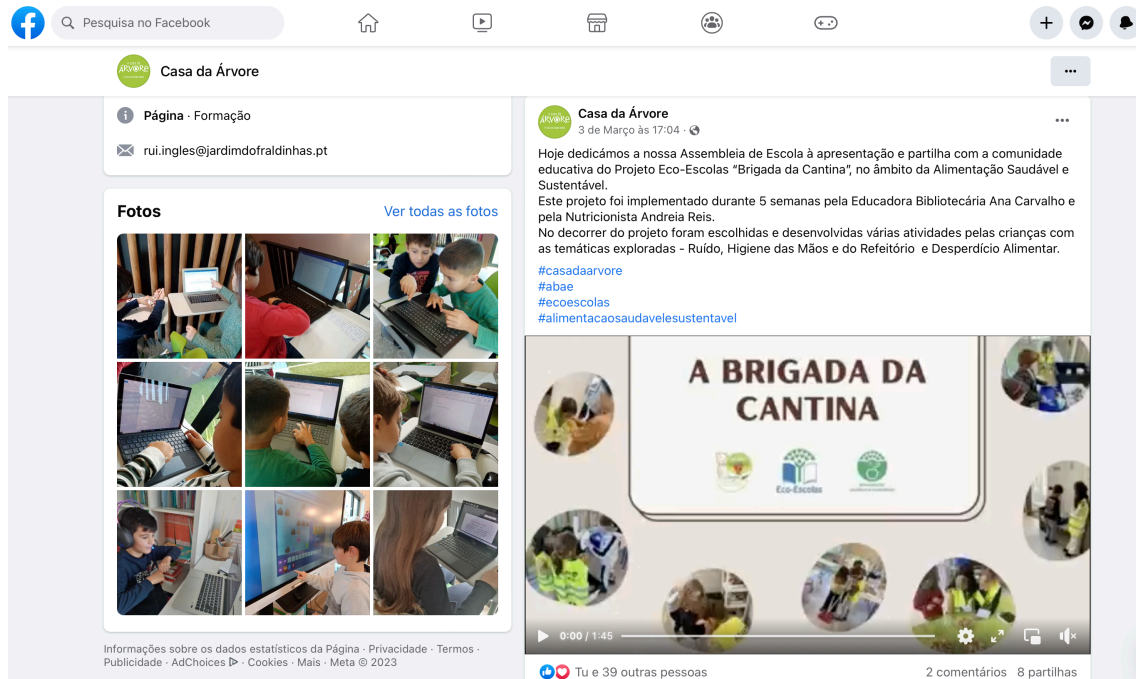
Figura 1 - Divulgação nas redes sociais