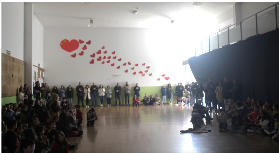
Figura 4 - Apresentação dos trabalhos em Assembleia de Escola