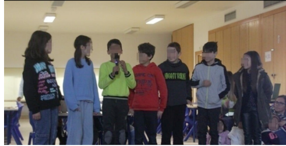
Figura 8 - Apresentação dos trabalhos em Assembleia de Escola (Desperdício Alimentar)