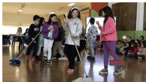
Figura 7 - Apresentação dos trabalhos em Assembleia de Escola (Higiene do Refeitório)