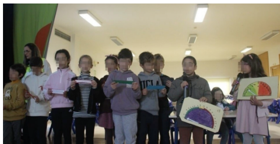
Figura 5 - Apresentação dos trabalhos em Assembleia de Escola (Ruído)