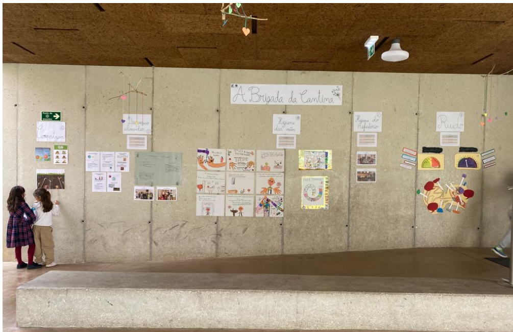
Figura 2 - Exposição do Projeto na entrada de escola (detalhes)