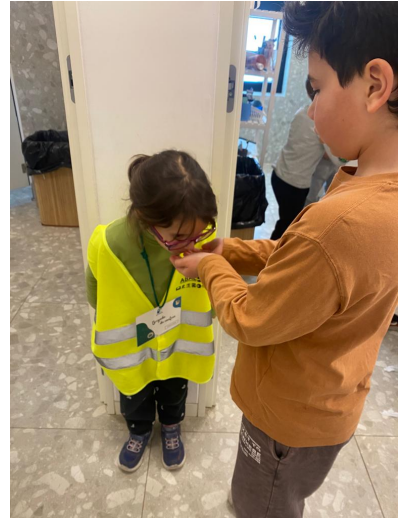
Figura 5 - Brigada da Cantina em ação (I)