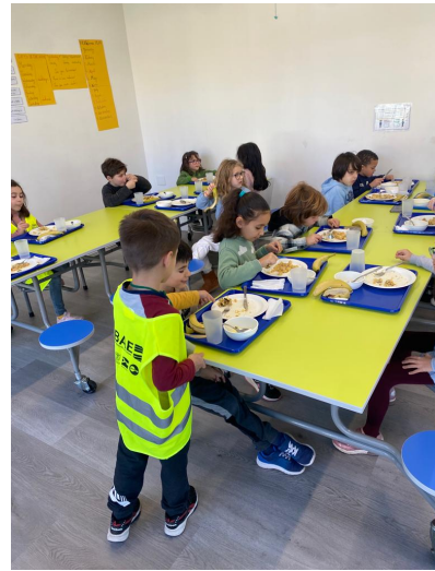
Figura 7 - Brigada da Cantina em ação (III)