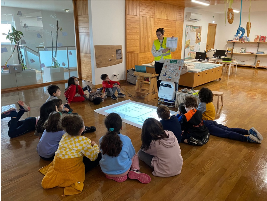
Figura 1 - Sessão com a Educadora Bibliotecária