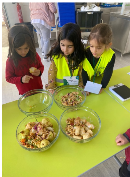
Figura 4 - Registos e pesagem nas horas de almoço