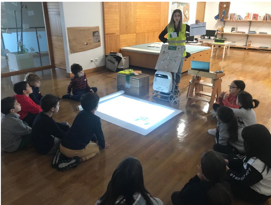
Figura 2 - Sessão com a Nutricionista