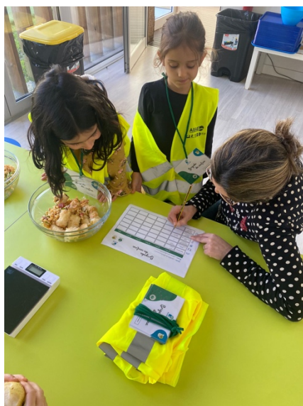
Figura 3 - Check-list utilizada nas horas de almoço