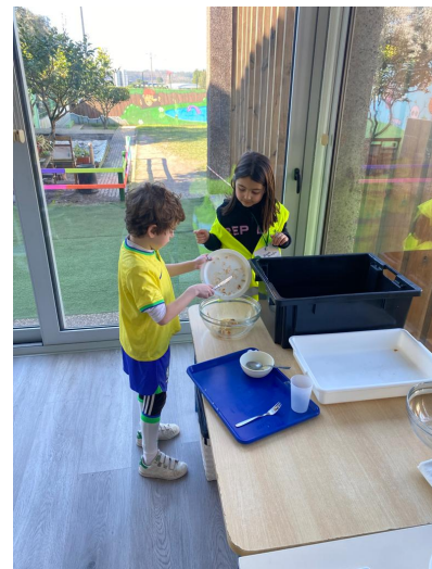
Figura 6 - Brigada da Cantina em ação (II)