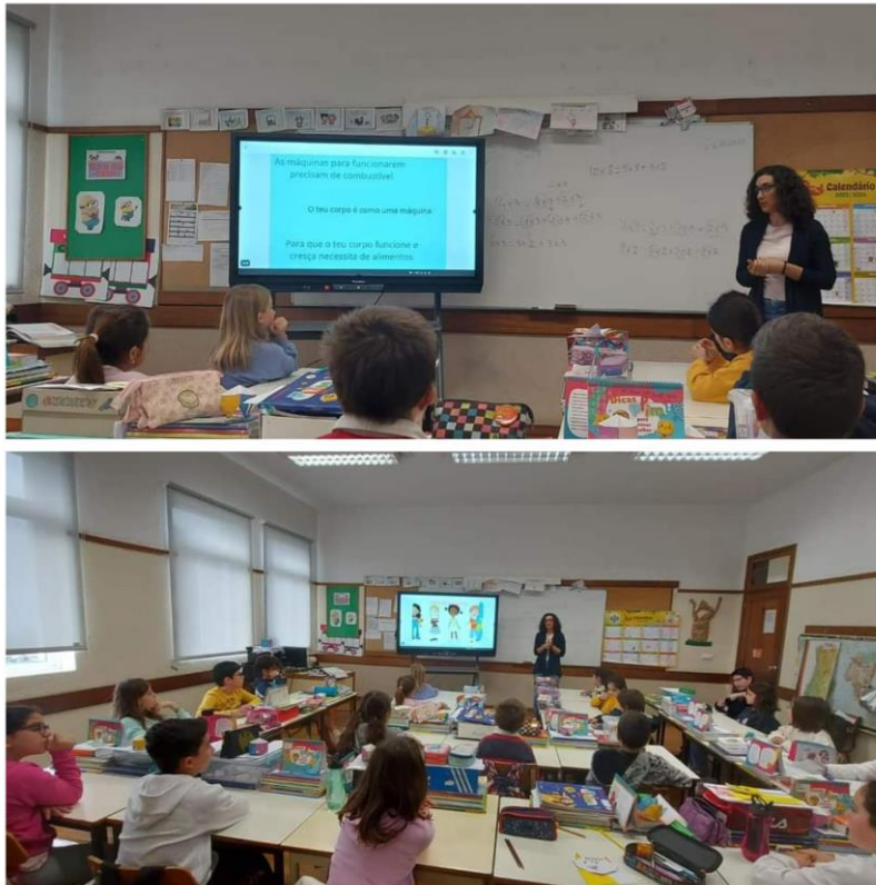
Fig. 5 Ação de Informação com Nutricionista do Centro de Saúde de Sto. António