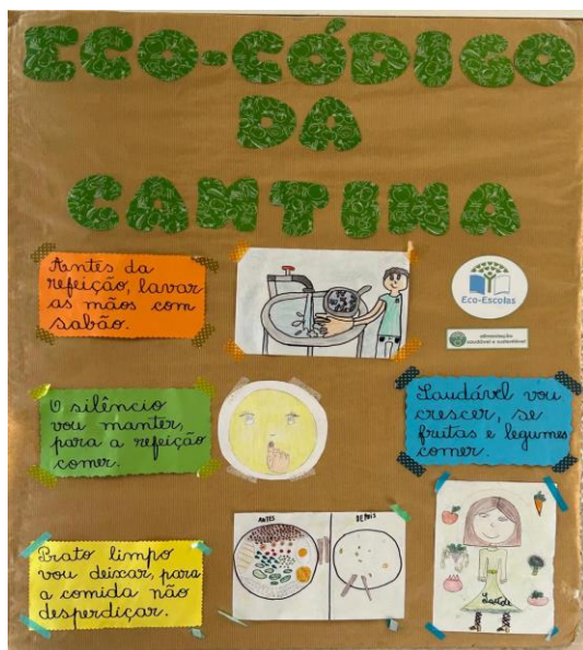
Fig. 1- Eco-Código da Cantina