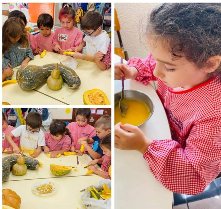
Fig.4 Confeção de Sopa de Cabacinha pelos alunos do Pré-Escolar