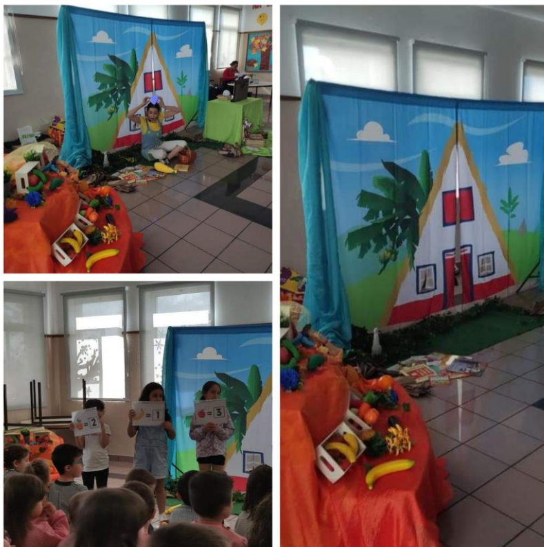
Fig. 3 Peça de Teatro “Joana Banana”