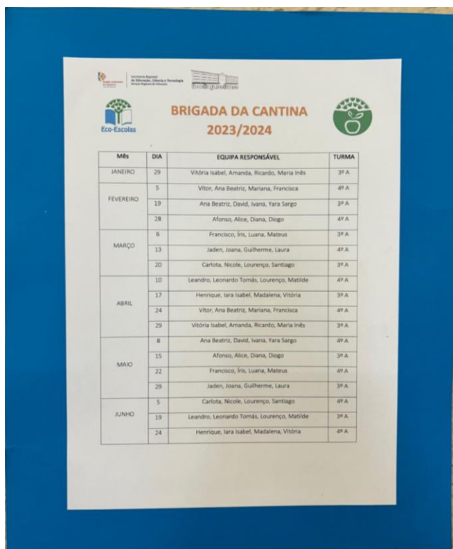
Fig. 2 – Grelha de Distribuição dos alunos da Brigada