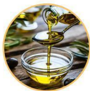
AZEITE DE OLIVA